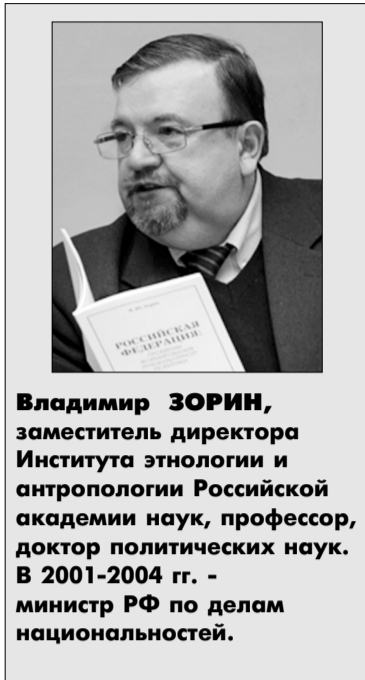
Владимир ЗОРИН, заместитель директора Института этнологии и антропологии Российской академии наук, профессор, доктор политических наук. В 2001-2004 гг. - министр РФ по делам национальностей.