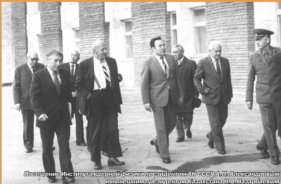
Посещение Института ядерной физики президентом АН СССР А.П. Александровым и нынешним президентом Казахстана Н.А. Назарбаевым