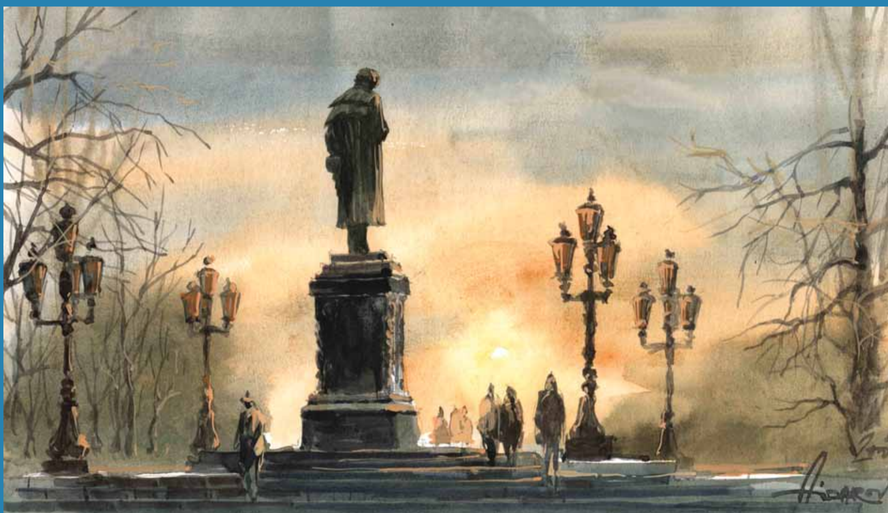
Художник И. Айдаров. «Сердца пленил стихом»